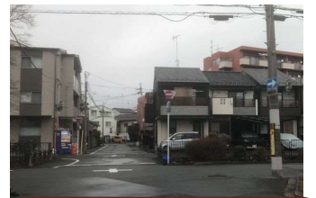
小雨とはいえ、なんと4日連続、雨の朝でした。これだけ続くのは最近の京都では珍しいです。恵みの雨となってくれば良いのですが。

金曜日に入試ですので、公立高校の在校生は明日から3連休になります。学年末テストも終わった学校が多く、ゆっくり過ごせそうな感じですが、テストが終わっても早速次の目標に向けてペースを落とさず勉強している高校生もいます。全力疾走でなくてもいい、こういう時に少しでも動けるかが今後の学習を左右しますので、ぜひ教室をご利用ください。特に高2生にとっては、いまが非常に大事な時期です。