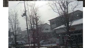
雪に覆われた京都の街。雪だるまに足をとめて写真を撮っていた人がいて、ちょっと嬉しくなった土曜日の寒い朝でした。