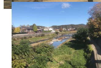
週明けの京都、いいお天気になりました。いつまでも暑い暑いと言ってるうちに、いつのまにか晩秋です。今週寒い日もあるようなので、気を付けて過ごしましょう。