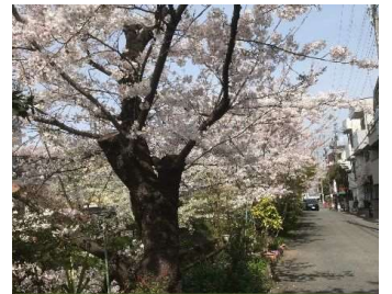
この季節、外に出ては桜にカメラを向けています。京都の桜は、週末に満開を迎えたようです。

学校が始まるといろんなことが新しくスタートします。使用する教材や年間の行事予定が分かりましたら、塾長に知らせて頂けると助かります。それらをもとに塾の予定も調整していきます。