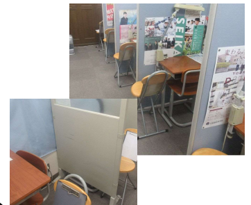
当塾、学習スペースのメインの座席は9席です。テストや受験の直前期に比べ、今はかなりゆったり使えます。毎日来て占拠するような人達の出現を待っています。